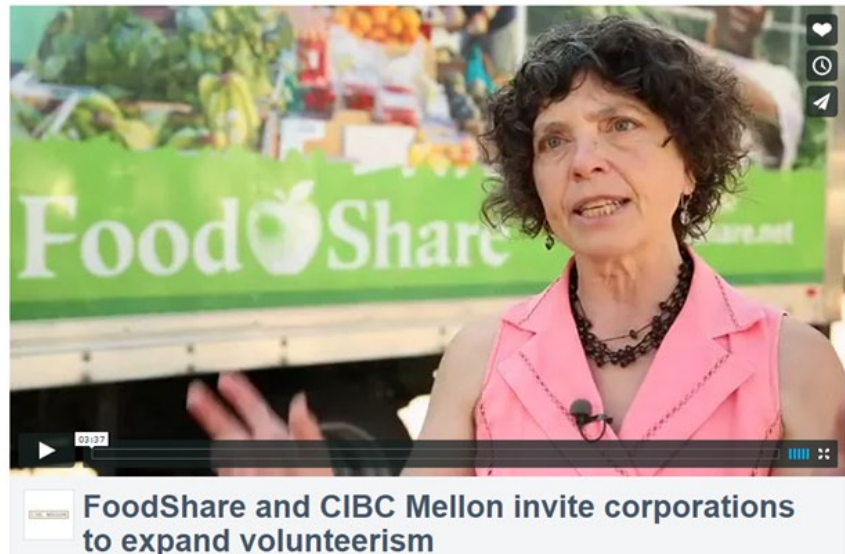
FoodShare and CIBC Mellon invite corporations to expand volunteerism

Nous avons hâte de continuer à travailler avec nos clients pour changer les choses dans nos collectivités.